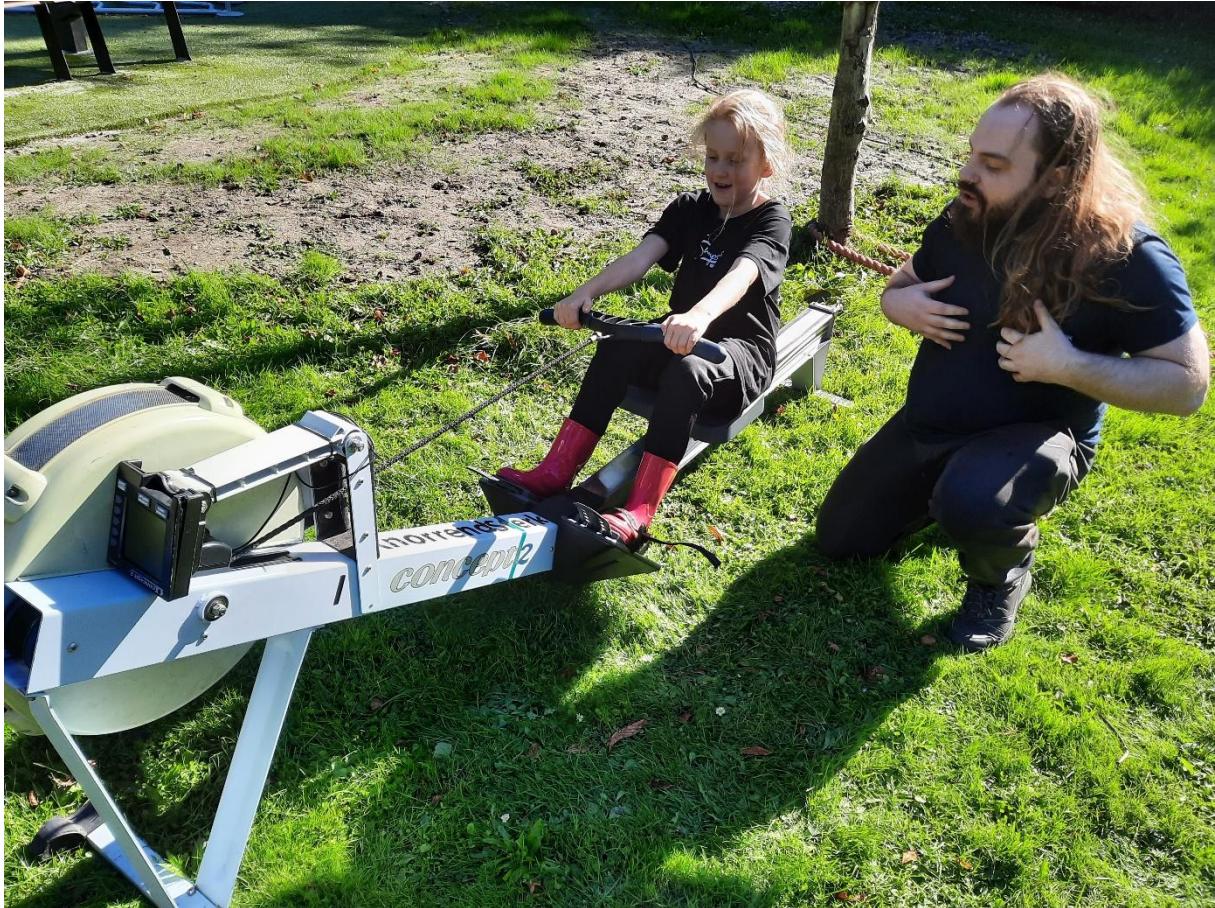
Kelderwerk op het Wijk In Beweging Festival, 24 september

Eerder in dit plan werd al aangegeven dat wij zo snel mogelijk trainingen en opleidingen willen inzetten, om de deskundigheid op de werkvloer te vergroten en mensen beter toe te rusten op hun toekomst. Dit gaat een jaarlijks te herhalen proces worden, waarbij wat ons betreft BHV en EHBO de hoogste prioriteit hebben. Daarnaast kan gedacht worden aan meer individueel toegesneden opleidingen als Sport en Bewegen op het Alfa-college, een vierjarige BBL-opleiding (niveau 3), waarbij mensen worden opgeleid tot sportcoach of fitnessinstructeur. Hiervoor is bij een aantal medewerkers van Kelderwerk al gerichte belangstelling, we proberen nu in samenwerking met de gemeente de financiering rond te krijgen. Ook is er belangstelling voor een cursus sportmassage.