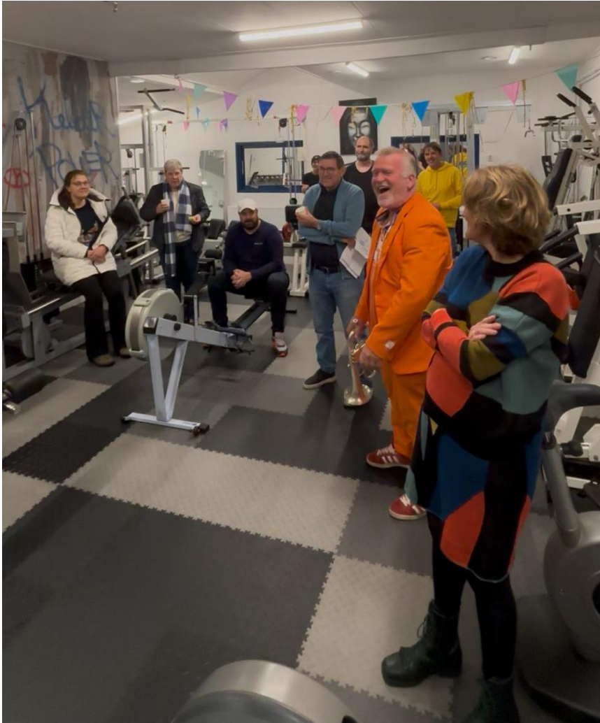
De Open Dag, 1 november 2025

evenement kon financieel worden gerealiseerd door een financiële bijdrage uit het MamaMini Goede Doelenfonds.